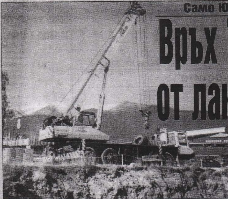
21 август. Бетон се излива за нов хотел до лифтената станция в Банско. Градчето има хотели с общ капацитет 4300 легла, но скоро ще станат 9000.