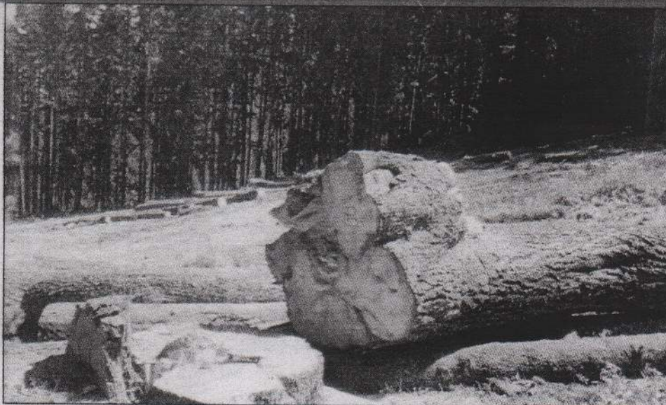
Вековни борове и мури са изсечени в средата на август т. г. за нова ски-писта под връх Тодорка. Изграждането на пистата е незаконно, защото тя отсъства от концесионния договор. Екоминистър Арсенова мълчи.

Изнесените данни за сечта това лято в ски-зона Банско бяха обсъдени от депутатите Георги Божинов (КБ), Евдокия Манева (ОДС), Теодора Литрова (НДСВ) и лично от шефа на комисията Джейвдет Чакъров (ДПС). Еко-министърката „знаела“ за публикацията още от 26 август т. г.