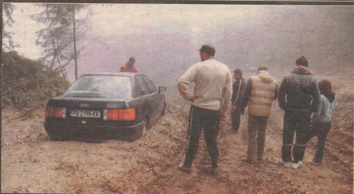
Това е след дъжд суперпистата, кръстена на Алберто Томба. Пловдивското ауди е застигнато от кално цунами, заляло асфалтовия път Банско - хижа Вихрен на 26 септември м. г.