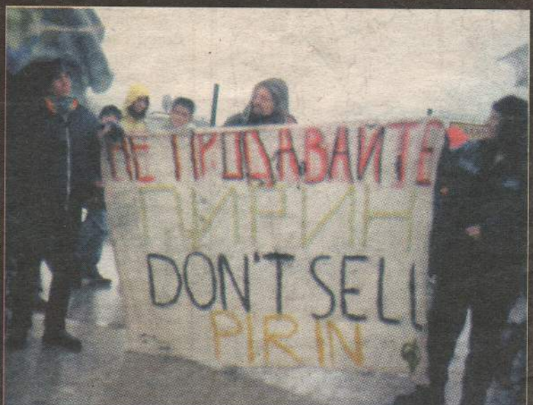
Банско. 18 декември 2004 г. Активисти на "Зелени Балкани" и "За Земята" протестират срещу тържественото откриване на новите незаконни ски-писти и лифтове под връх Тодорка.

На картата на ски-зона с център Банско в червено е незаконната сеч за писти и лифтове. С цифри е указана ширината на пистите, които трябва да са не по-широки от 30 м. Оранжевото кръгче сочи къде калното свлачище затрупва колите по асфалтовия път Банско - х. Вихрен.