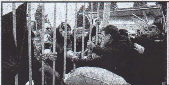
От студентския съвет на вуза са категорични в готовността си да обявят национален протест при необходимост. Те ще получат поддръпка на свои колеги в цялата страна

- Всеки прави каквото си иска, няма никакъв проблем.