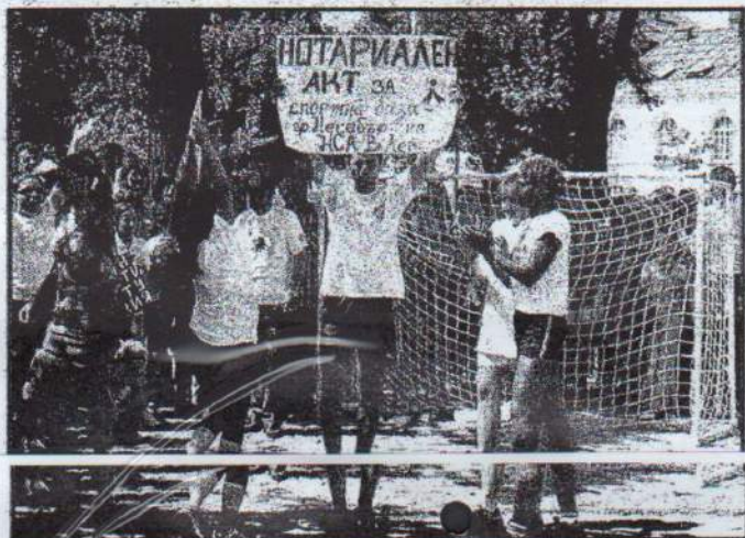
Студентите от НСА няма да се откажат в борбата за базата в Равда