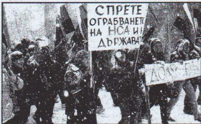
През февруари повече от 1200 студенти от НСА излязоха на протест, който тръгна от арката пред академията. Последва решение на МС, то обаче не наклони везните в полза на вуза