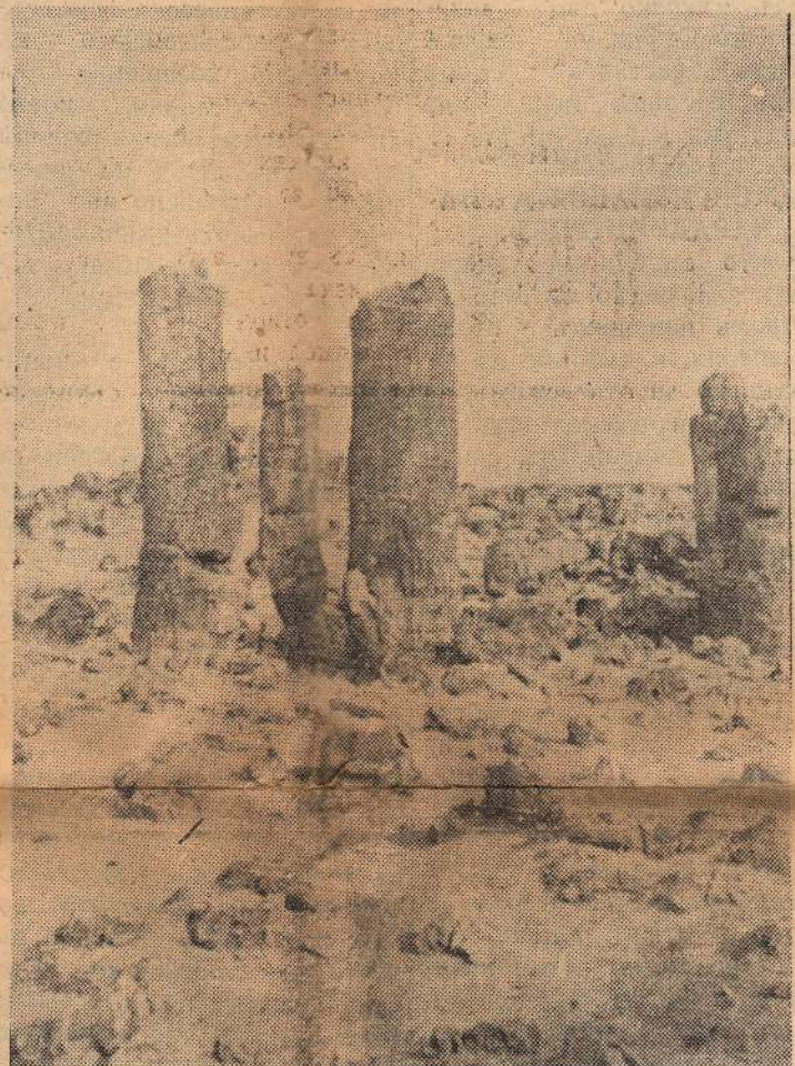
„ОмагЪосаната гора“ — Дикили ташЪ.

ГрандиозниятЪ площадЪ предЪ църквата „Св. Св. ПетърЪ и ПавелЪ“ вЪ РимЪ за цЪлЪ пътЪ отЪ стЪтци години ще бЪде препостланЪ. За това ще бЪдатЪ необходими надЪ 3 милиона лирети, половината отЪ които ще бЪдатЪ дадени отЪ Ватикана, а другата половина отЪ италианското правителство.