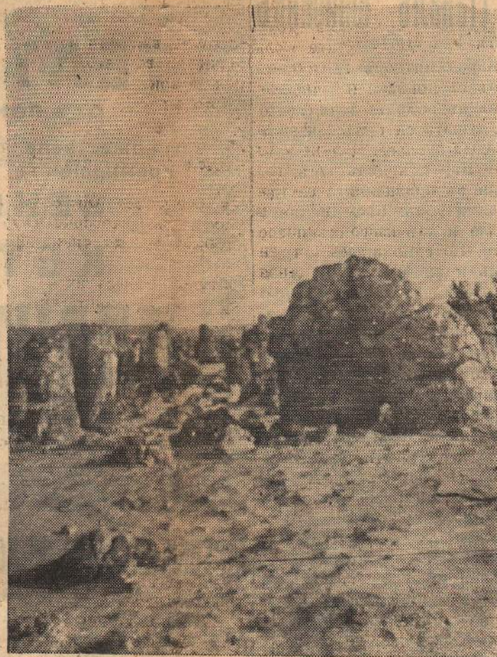
Дикили ташЪ — чудото на природата.

Ние изпълняваме своя тереси на цЪлото ни стече-