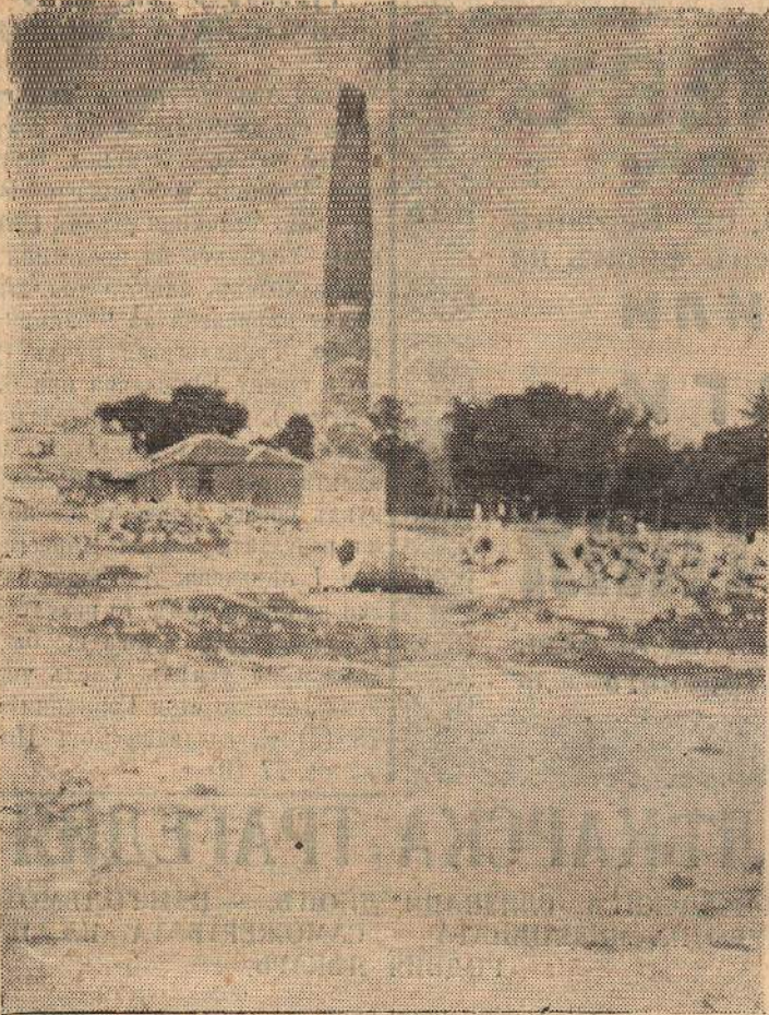
Паметникът в с. Гебедже, направен от изрЪзани стълбове от „ОмагЪосаната гора“.

Малката наша родина, красивата България, която има много малко с което може да се гордее, страда от скодоумие и варварски похвати. Колко по-привлЪчителна би изглеждала, ако не само пазиме, но и разхубавяваме това, което имаме. Но за това се иска настойчивЪ труд, като първо пресЪчемЪ и изкЪртимЪ ноктите на она зълЪ дух на рушение, който е заседналЪ у