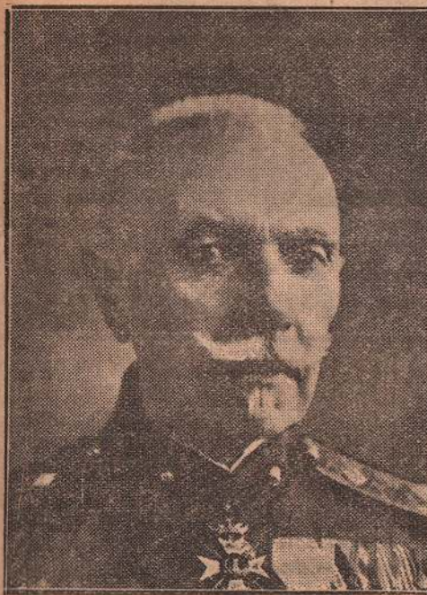
Генералъ Никола Ивановъ командуващъ II армия

На 11 мартъ въ 13 часа батареитъ отъ западния и южния сектори започнаха да сипятъ огънь по турскитъ батареи и укрепления. А на източния сек-